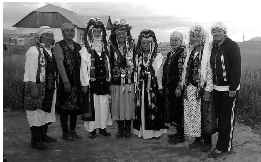
Алай району, Сары-Могол айылында Калыак тобу.

Кошоктор коңшу элдерде – тажик, түркмөн, өзбек, казактарда да кездешет. Бизге келип жеткен маалыматтар боюнча аза күтүү салтында кошокту аткарып жаткан адам каза болгон адамга эң жакын туугандары боло турган болсо, ал чачтарын жазып, көкүрөгүн койгулап, бетине из салып, тытып, орду толгус жоготуу күйүттү ушундай сыртка чыгаруу менен өксүп аткарган. Аза күтүүдөгү мындай форма ыйлоо менен өзүн-өзү уруп согуп кыйноо, бетин тытуу, чачын жазуу өңдүү көрүнүш көпчүлүк дүйнө элдеринде кездешет. Маселен Д.Фрезер өзүнүн “Фольклор в ветхом завете” деген эмгегинде өлүк коюу салтындагы мындай өзүн уруп - согуп, ички күйүтүн, эмоциясын сыртка чыгарып кошуп, жоктоо боюнча бир катар мисалдарды келтирет. Мисалы семит элинен байыркы арабдарда, тактап айтканда, байыркы еврейлерде бул эки салт тең колдонулгандыгын белгилейт. Арабдардын аялдары, аза күтүү убагында өзүлөрүнүн көйнөктөрүн айрып, көкүрөгүн тырмактап, бетин тытып, бут кийимин чечип алып