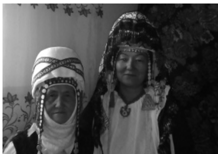
Алай районундагы кошокчулар менен.

Басасың жолдун тегизин, Сүйлөйсүң ойдун негизин. Айланайын, жан эжем, Жаннатти болгун илайым. Көп ыйласа күнөө дейт, Күнөө болбой курусун. Көзүмдөн аккан көз жашым, Ак бейитиңе нур болсун.