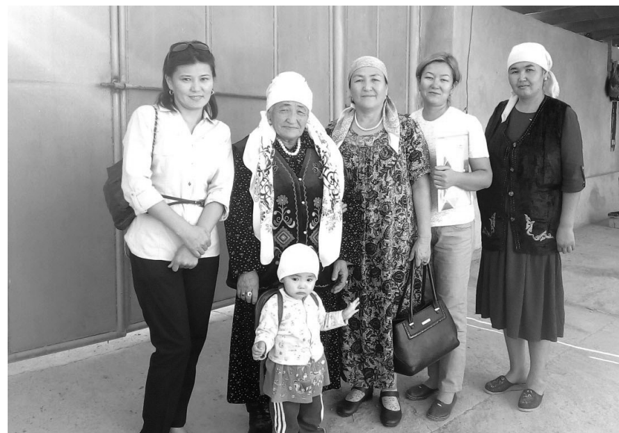
Сузак району, Кара-Дарыя айылындагы кошокчулар менен.