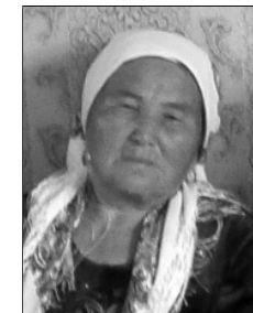
Джайнакова Канахат Төбө-Коргон айыл өкмөтү, Интернационал айылы, 1953-жылы туулган. Өзбекстандан ушул айылга келин болгон