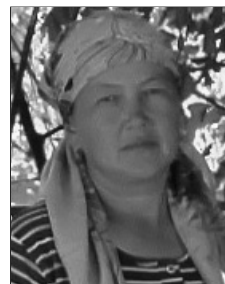
Приева Дамира Папан айыл өкмөтү, Кызыл-Туу айылы, 1976-жылы туулган, багыш

Жети бир кабат кыл аркан, Атама, жети айлансам кетпеген. Көргөнүм, атам намыскөй, Атамын, жеринен байлык кетпеген.