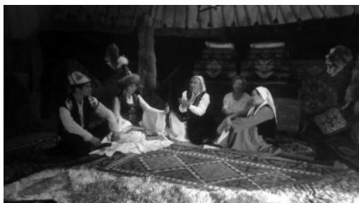
Видеоролик тартуу учурунда

өзүн койгулап, чачтарын кесишкен. Ал эми Грецияда жакындары каза болгондо, аны жоктоп ыйлаганда аялдар чачтарын кыркып, беттерин канатып, кээде мойнун тытып салышкан. Эркектери да өлгөн адамга урмат көрсөтүү иретинде аза күтүүнүн белгиси катары чачтарын алдырып коюшкан.