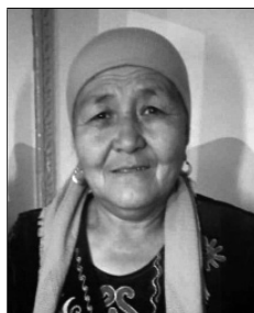
Осмоналива Турдукан Кенжегул айылы, 1959-жылы туулган, мөнөк

Жети старчин бир болуш, Жети атаң конгон чоң конуш. Чоң конушка конуп өт, Чоюлган келин болуп өт.